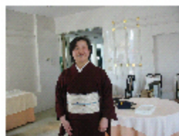
ブローチを帯留めに