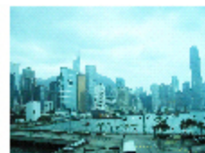
～重い 香港の空 会場から～

安く行けるので、と軽く話しに跳びのったものの、3月も終わるといのに寒くて部屋にストーブを入れてもらう。いつも海外に行くといくつもの目の覚める想いがある。滯んでいた血液がハイドンの曲と一緒に流れているようだった。