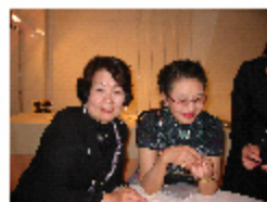
可愛いピンクに興奮

やった、やったゾー！ というわけで、N.Yジュエリーショー (05/7/31~8/3) の2階ブースへの出展が許可されました。 一昨年、見学に行った時、出展するならココ、と決めていたのですがそこは全米デザイナーズギルドメンバーのみの出展とのこと。諦めていた矢先、作品審査にパスすれば可能という情報が入り、時間がないので即パソコンに入っていた素人デジカメ写真(無謀!)を送ったのが3月。4月半ばすぎてやっと審査通過の報が入ったのです。 選ばれるのは世界で10人の作家。そして選ばれるとさきのギルドメンバーとして承認されニューデザイナーズギャラリーへの出展が許可されるのだそうです。