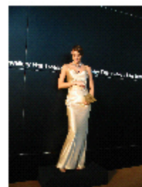
～頭サイズ極小 さすがモデル！～