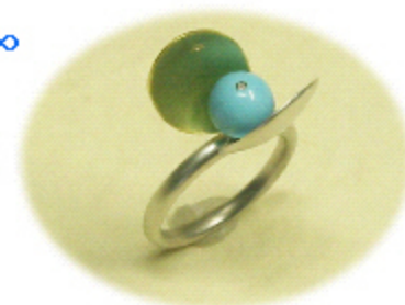
K18YG SV ダイヤ トルコ石

金色と白い貝殻が 空に向かって伸びている 真ん中に 波から生まれたようなトルコ石 耳に近づけると 押したり引いたりする 波の音が聞こえそう