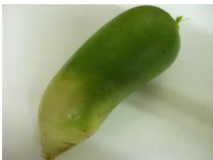
甘大根ってこんなもの

やっと決別しました！10数年来の皮膚科の薬と。最終的にはアロマのお店の力を借りて。肌に残る薬の残留物を取り除きつつ水のような化粧水だけです。その間カオは赤く腫れるようなのを耐える。今では晴れて薬に頼らず、その