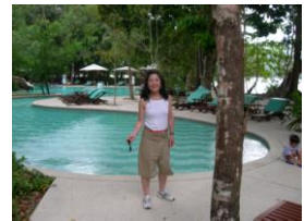
マレー人のボーイさんが 撮ってくれました