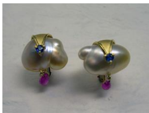
バロックパール サファイア K18YG

ドイツ・ミュンヘンの国際ジュエリーショーの高〜い天井から巨大な2枚のパネルが下がっていた。1枚は若い女性の軽やかな白いTシャツにジュエリー。もう1枚は額も目尻もたっぷりとしわが入った中年女性。最初眼にとまったのは若い女性。でも、貫禄たっぷりの人生を感じさせる太い腕の女性にしみじみ見入る。温かさと深い味わいが感じられ、ほっと息の抜ける安心感がある。そして、何よりも人間としての輝きがある。若い女性の輝きと違うもの。悪くないもんだなあ、年取るって。いや、もっといい。年取るとは良いことだ。十分若くない、でも老人ではない、自分の弱さも良さも知り、そして優しくなれる。やはり年を重ねるのは良いことだ。