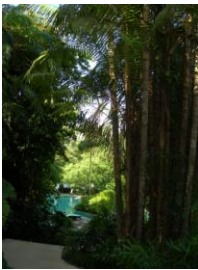
ホテルは密林に囲まれ プールも密林の中

大きな自然に抱かれているという安らぎ（それがこのホテルのコンセプトなのだ）。人間の日々の小さな営み、蟻のようで哀しくもあり、いとおしくもなる。