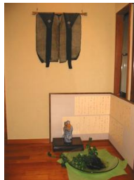
麻の袴と 爽やかなアイビー