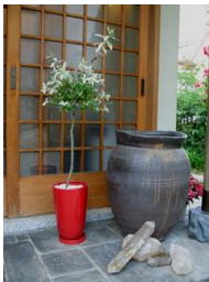
大きな水晶と 赤いポットに植えた 白露錦